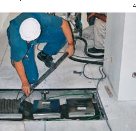
Das Thema „Brandschutz“ wird immer wichtiger. Hier werden gerade Verteilerschächte abgeschottet.