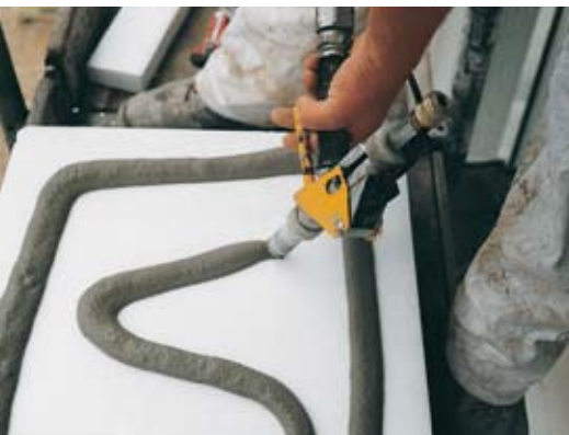
Mit unserer Klebepistole und dem Sprayboy® geht auch das Verarbeiten von Klebemörtel für WDV-Systeme leicht von der Hand.